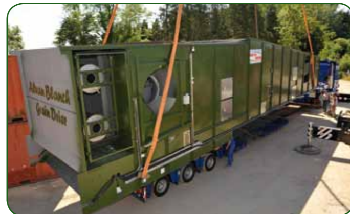
DF48000 išvažiuoja iš Chelworth gamyklos.