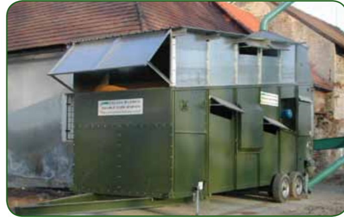
Mobili DF10500, 11t/hr